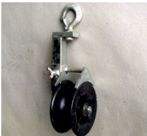
Freileitungsrolle Ø 148 mm Rollenkörper aus Kunststoff Overhead line roller dia. 148 mm Plastic roller