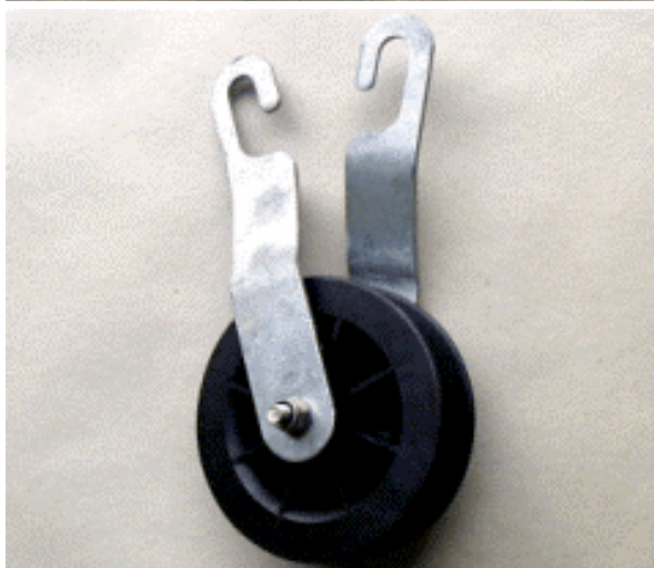
Hängerrolle Ø 150 Suspension roller dia. 150